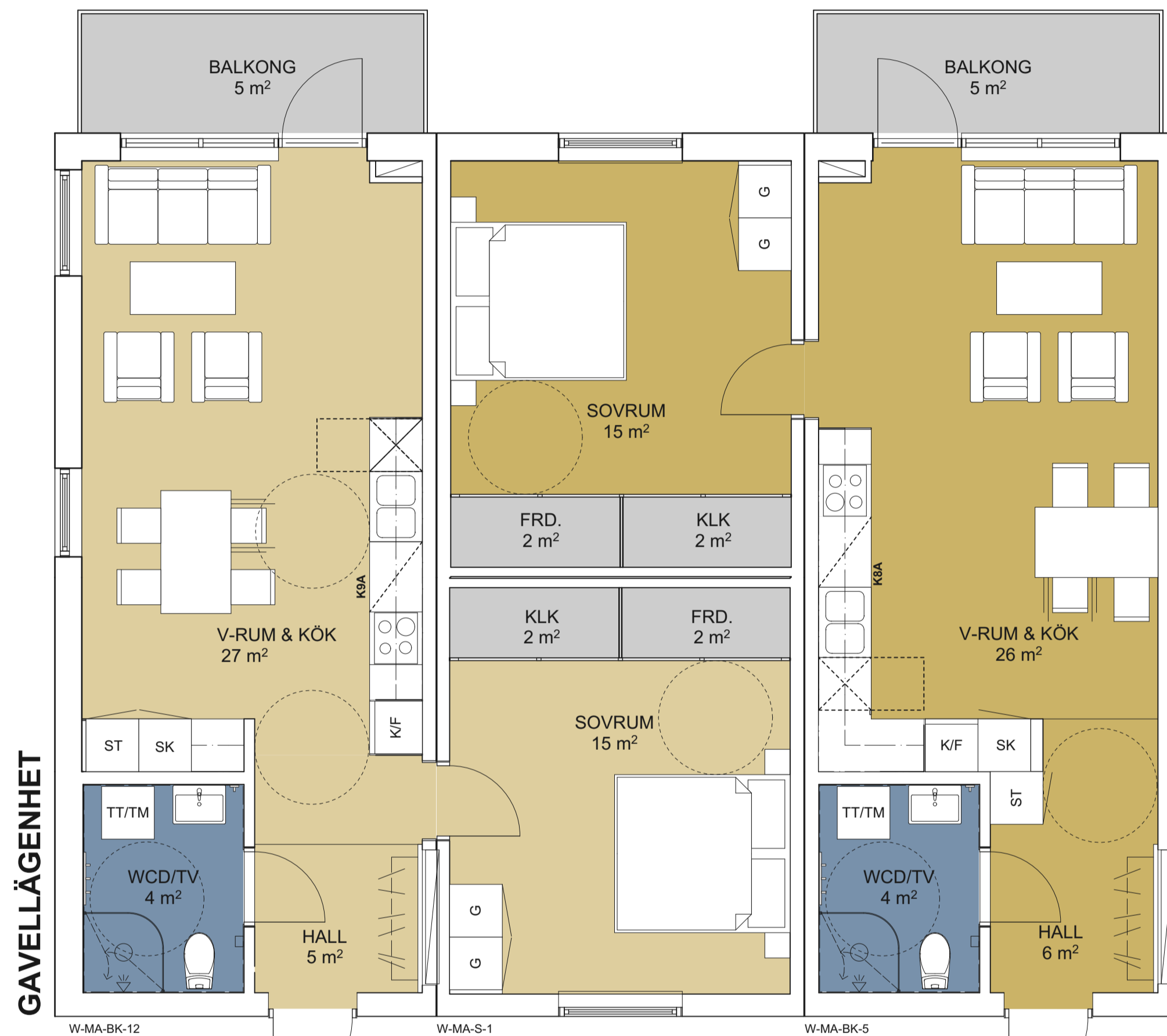
W-LA1.5-2GVB LÄGENHET 2 RoK BOA: 55,7 kvm