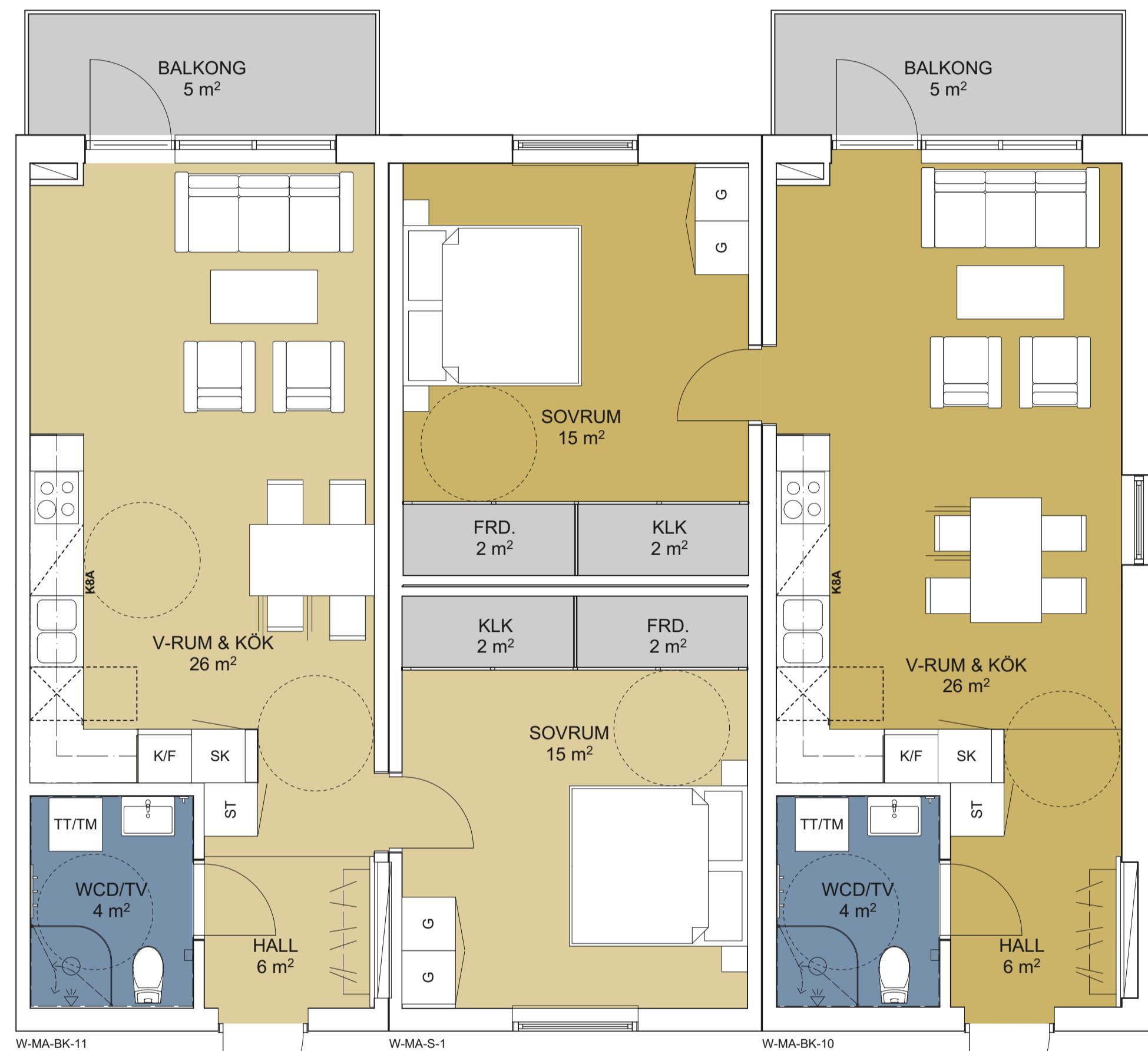
W-LA1.5-2VB LÄGENHET 2 RoK BOA: 55,7 kvm