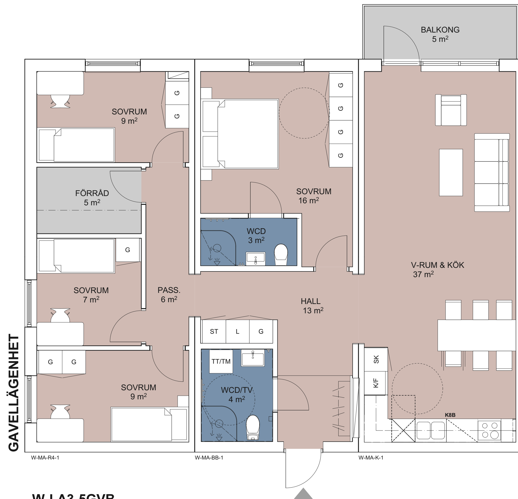
W-LA3-5GVB LÄGENHET 5 RoK BOA: 115,7 kvm